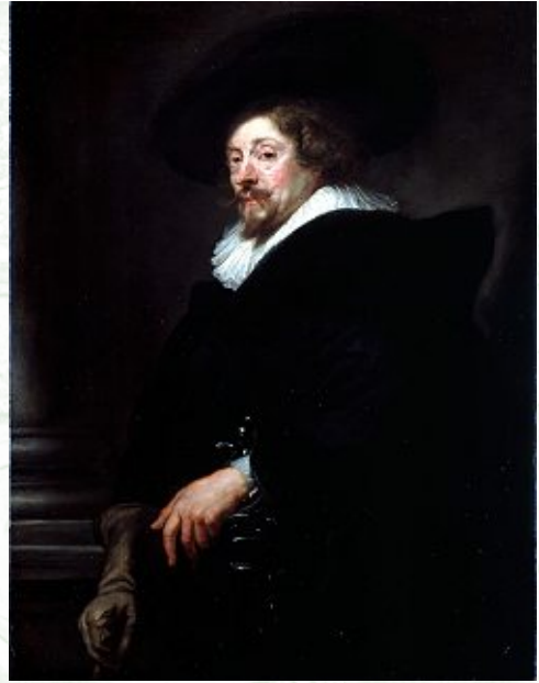
ルーベンス「自画像」