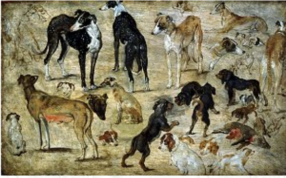
ヤン・ブリューゲル「動物の習作（犬）」