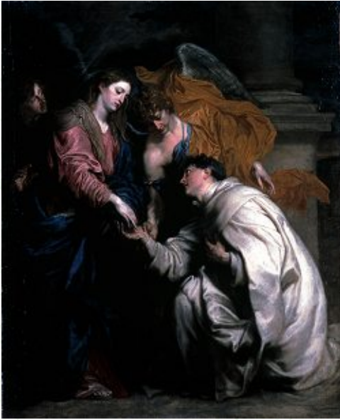
ファン・ダイク 「マリアと福者ヘルマン・ヨーゼフの神秘の婚約」