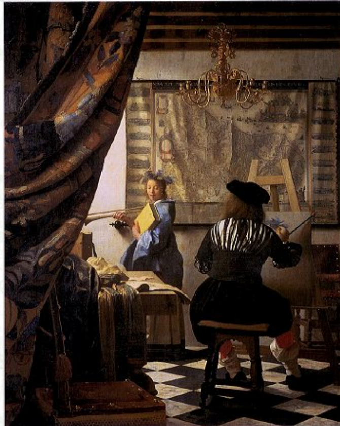
ヨハネス・フェルメール・ファン・デルフト「画家のアトリエ（絵画芸術）」