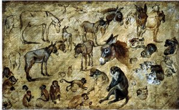
ヤン・ブリューゲル「動物の習作（驢馬、猫、猿）」