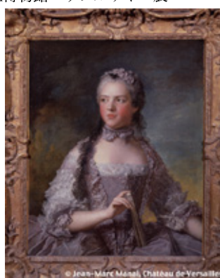
フランス王女アデライド